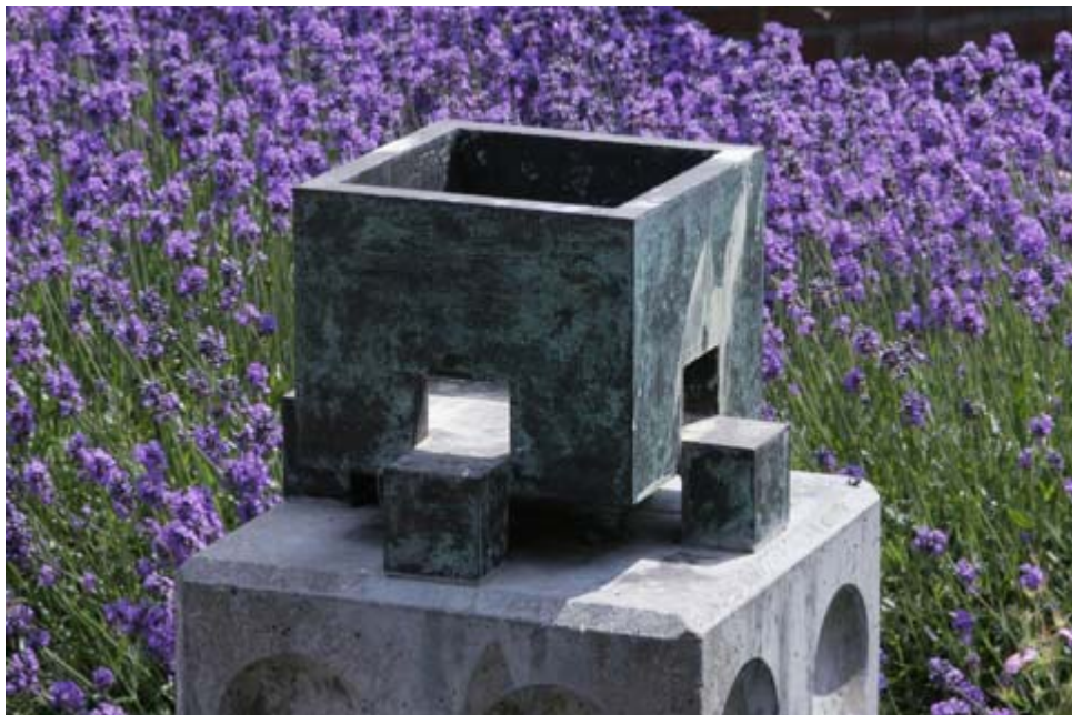
Impluvium 1996, Jeroen van Rijn

Verder zal de Kunstcommissie gevraagd worden te adviseren bij projecten met betrekking tot inrichting van de openbare ruimte.