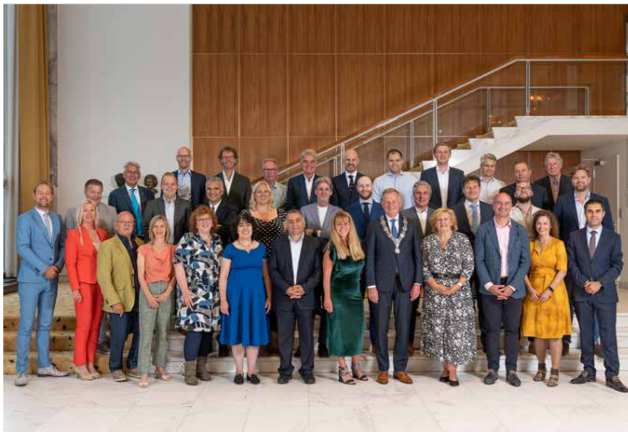
De gemeenteraad, juni 2022