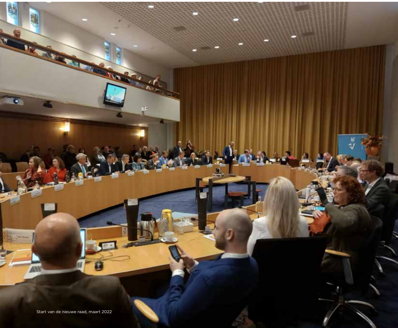
Start van de nieuwe raad, maart 2022