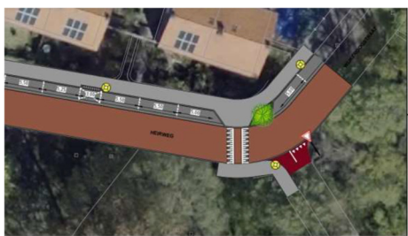
Figuur Voorlopig ontwerp: Zijde bromfietspad is het aanwezige trottoir verlengd en zijde woningen is voor voetgangers in combinatie met en verkeersdrempel een oversteekmogelijk gerealiseerd.

De Fietsersbond heeft als lid van de Klankbordgroep verzocht de herkenbaarheid van het kruispunt te verbeteren en het bestaande bord B6 te verwijderen. In het voorlopige ontwerp is de voorrangsregeling echter gehandhaafd. (bebording opnieuw incompleet!). Bij de stukken die ter inzage liggen ontbreekt een onderbouwing.